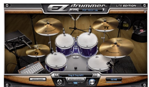
Toontrack EZdrummer® Lite