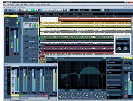
Steinberg® Cuebase™ LE4

Az erőteljes keverőfelület segítségével könnyedén konfigurálhatjuk a jel útját, és rendkívül gyorsan és egyszerűen beállíthatjuk a real-time dinamikákat és a parametrikus EQ-t is.