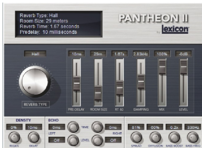
Pantheon II VST/AU Zengető Plug-in