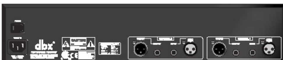
231- Dual Channel 31 Band Graphic EQ