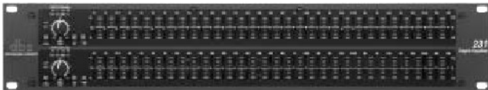
231- Dual Channel 31 Band Graphic EQ